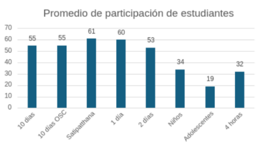
Figura 3: Promedio de participación en cursos, estudiantes

La figura 3 muestra el promedio de participación de estudiantes en los diferentes tipos de Cursos: